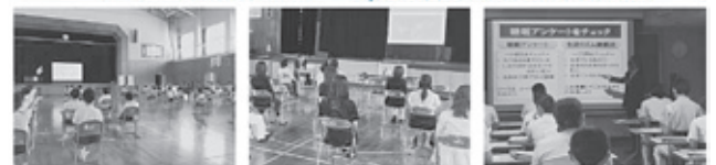
睡眠セミナーの様子

睡眠セミナー講師は新型コロナウイルスの感染予防対策(検温・うがい・手指のアルコール消毒・マスク等の着用・受講者とのソーシャルディスタンスの確保等)を行いながらセミナーを実施しています。