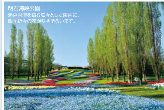
明石海峡公園 瀬戸内海を臨む広々とした園内に、四季折々の花が咲きそります。

2 淡路カントリーガーデン 〈体験型レジャースポット〉 ☎0799-82-2953 ウサギやヒツジなどかわいい動物がいっぱい! 併設されているハンバーガーショップsafsafの「あわじ大地のバーガー」や「あわじミルクのソフト」は絶品です。