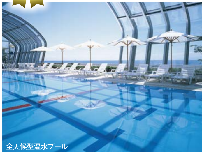
全天候型温水プール