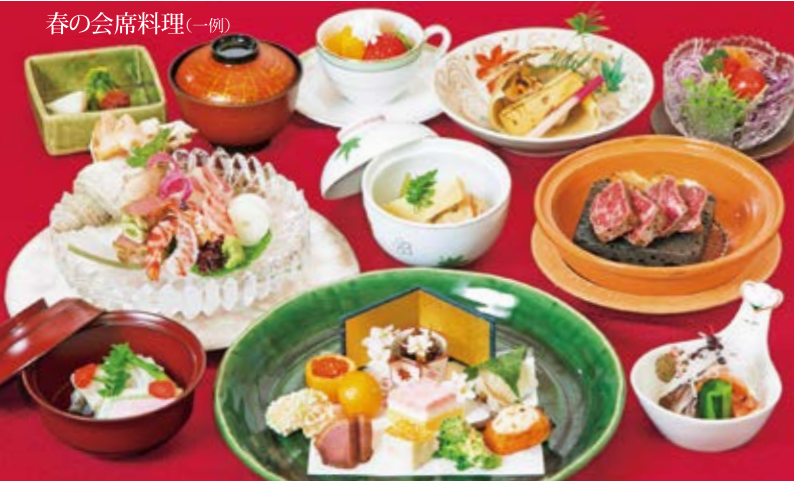
春の会席料理(一例)