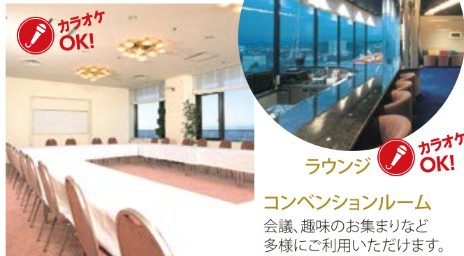
レイアウト・収容人数【マイク・ホワイトボード・机・椅子は料金に含まれております】