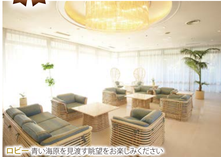
ロビー 青い海原を見渡す眺望をお楽しみください