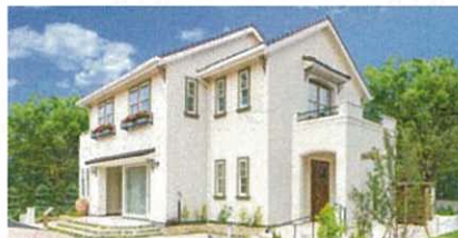
前橋モデルハウス