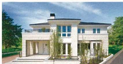
高崎モデルハウス