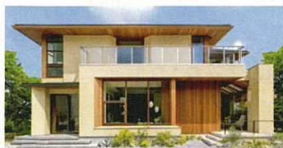
高崎駅前モデルハウス