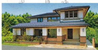
新前橋モデルハウス