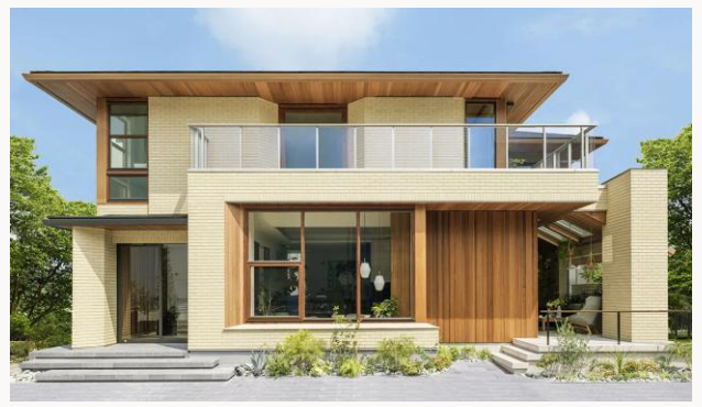
暮らしの四季を、綴る家。 高崎市栄町22-34