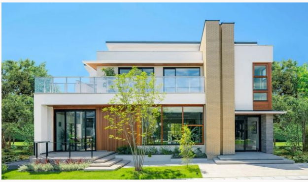
空間を開放し、心を解き放つ家。 北群馬郡吉岡町大久保550-1