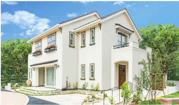
こういう家、あったらいいな。 前橋市鶴光路町765