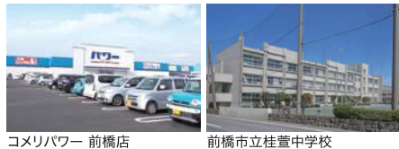
コメリパワー 前橋店