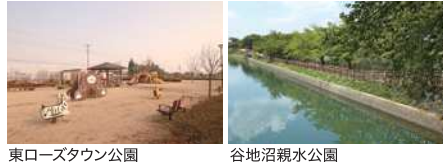
東ローズタウン公園