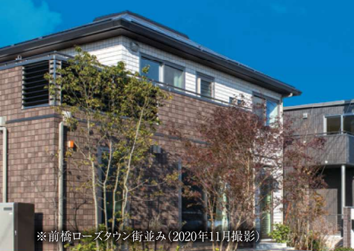
※前橋ローズタウン街並み(2020年11月撮影)