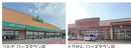
ツルヤ ローズタウン店