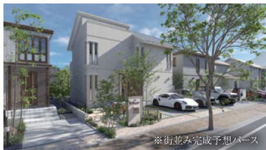
※街並み完成予想パース

安心のセキスイハイム施工で、 家族の理想をかたちにする住まいづくりが 始まります。