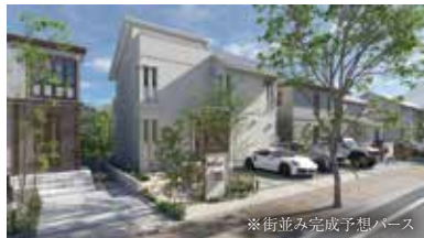
※街並み完成予想パース

安心のセキスイハイム施工で、 家族の理想をかたちにする住まいづくりが 始まります。