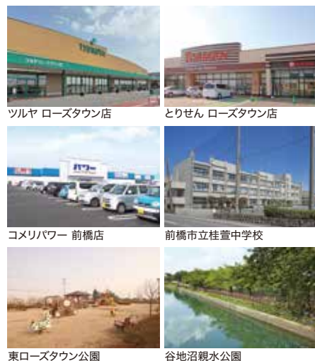
東ローズタウン公園