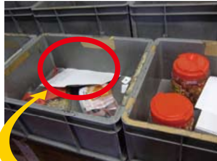
個人ごとに注文内容が記載されている注文票。