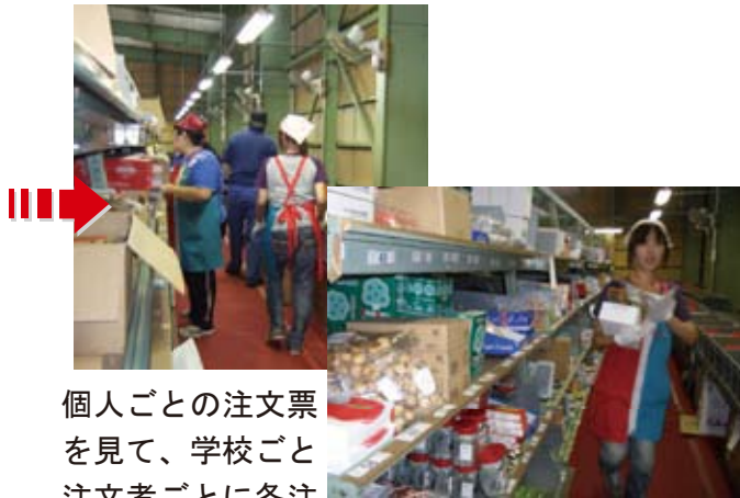
個人ごとの注文票を見て、学校ごと注文者ごとに各注文品を棚から取り、箱に入れます。