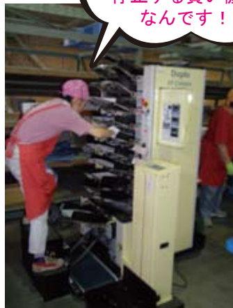
そのチラシをこの機械に上から順番にセットします。