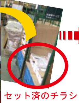
セット済のチラシ