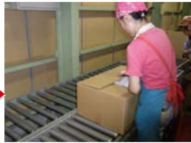
送り状を貼って完了！