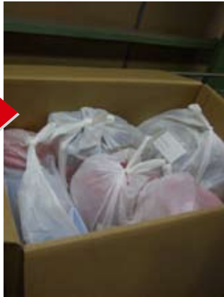
箱の一番下にはチラシが入っています。