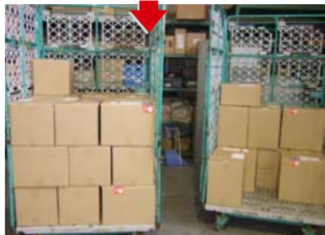
箱の荷崩れや破損を防ぐため、同じ大きさの箱を積んでいきます。