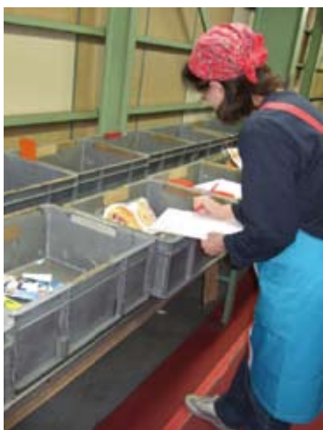
検品作業は、ベテランの方が専属で行います。商品名と商品を一品ずつ照合していきます。