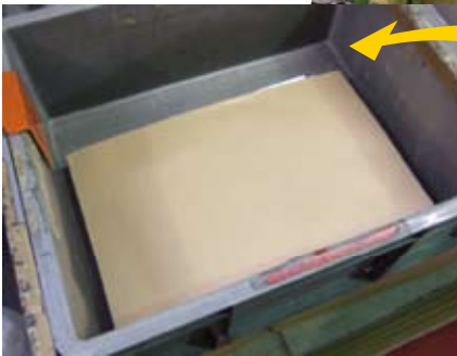
送り先ごとに指定のチラシ部数もセットします。