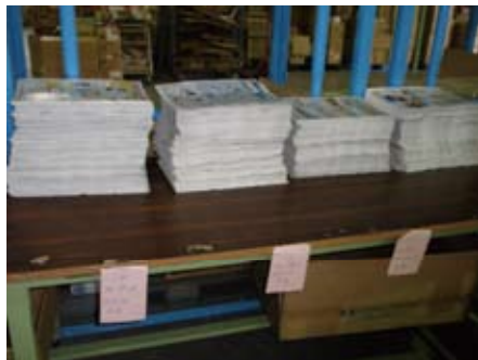
企画や種類ごとに順番にチラシを並べかえます。