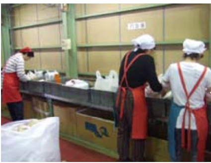
検品が終わったものを、個人ごとに袋詰めしていきます。