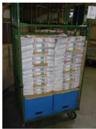
こちらが1000セット積んだカゴ車です！