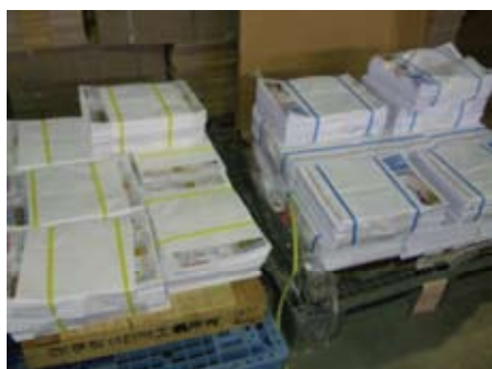
各業者・印刷所などから多種類のチラシが納品されます。