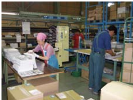
1回にお届けするチラシのセット作業は、通常2人で1日半かかります。