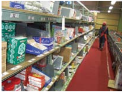
企画・商品番号ごとに棚へ商品を並べます。この作業だけで約半日はかかります。