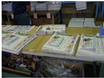
セットされて出てきたチラシを、学校ごとに数えやすいよう10セットずつの束にします。